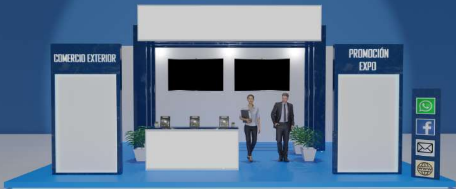
Global Platinum & Global Diamond